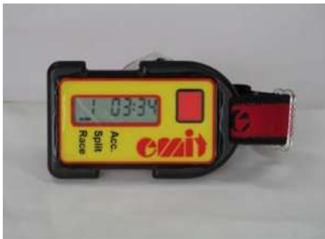
E カード（色、ディスプレイが違う可能性があります）

参加者のみなさんは E カード（計測カード）を必ず持ってスタートします。コントロールではユニットに E カードをきちんとはめなくてはなりません。それにより電子的な通過記録が行われます。