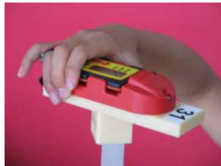
コントロールではユニットにきちんとはめます